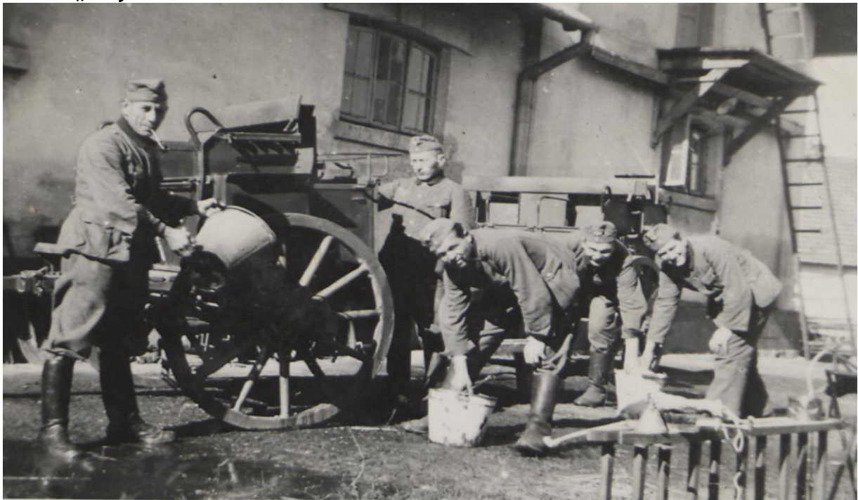
Fot. 6. „Przy wozie na obornik”

Pierwszy z nich to ujęcia polskich miejscowości - ulic, budynków, wojennych zniszczeń i sporadycznie ludności cywilnej. Druga grupa zdjęć przedstawia codzienne życie żołnierzy niemieckich na froncie - np. wspólne posiłki oraz czyszczenie sprzętu wojskowego. Do ostatniej tematycznie grupy można zaliczyć te fotografie, które przedstawiają niecodzienne dla autora wydarzenia. Wśród nich można odnaleźć przykładowo kilka zdjęć wykołonego pociągu pancernego.