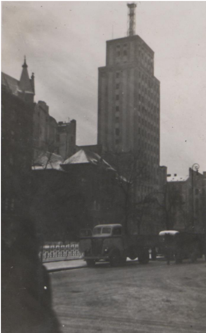
Fot. 9. Warszawa