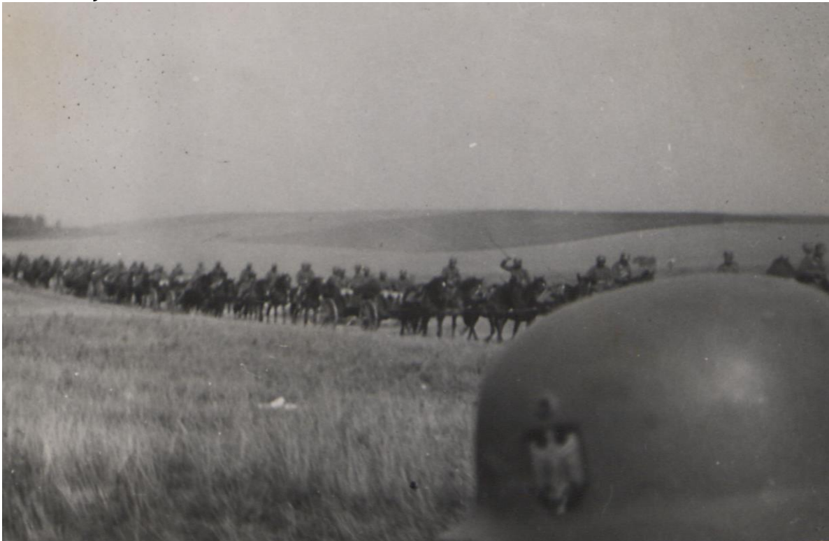
Fot. 3. Wymarsz w kierunku Polski