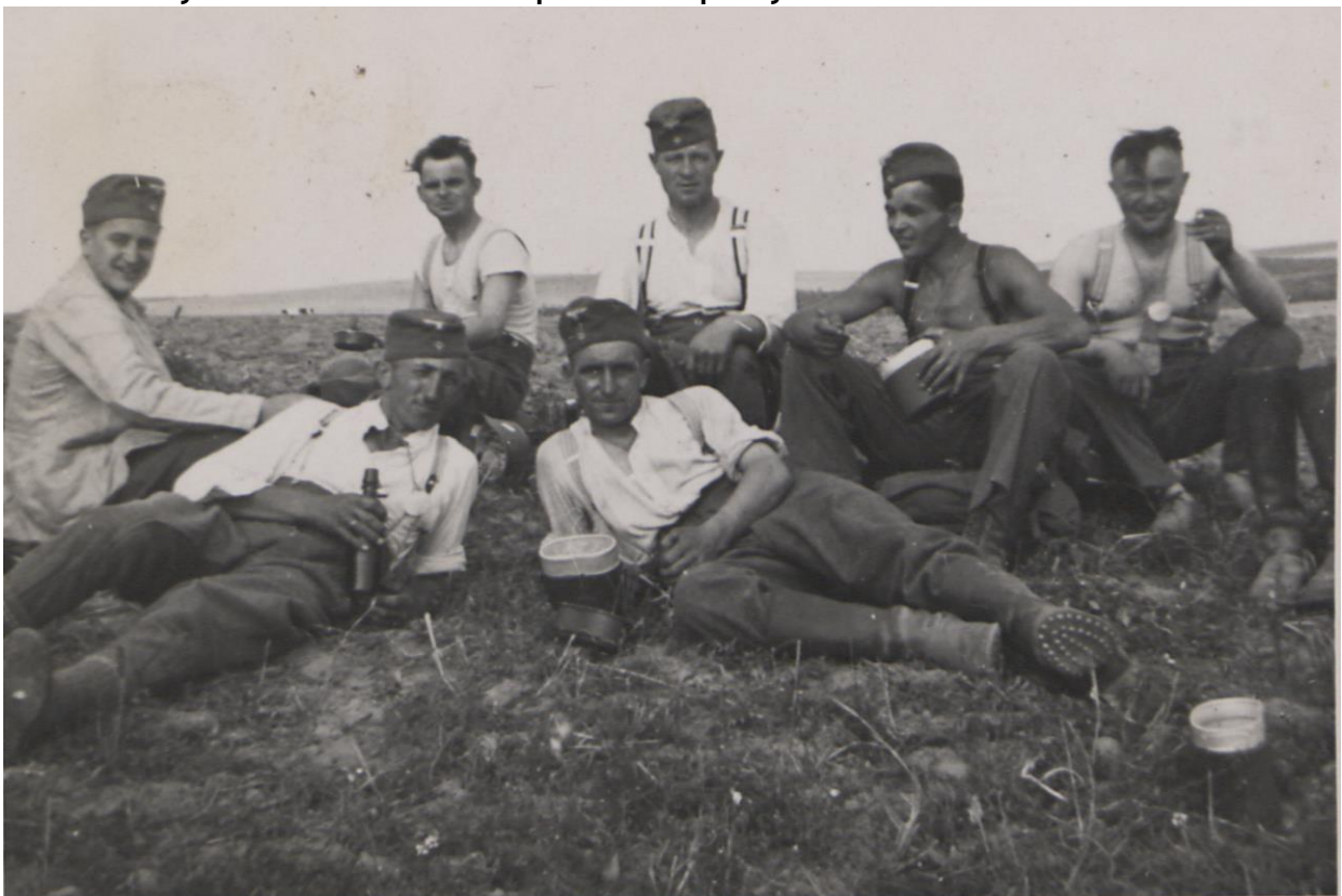
Fot. 2. Prusy Wschodnie. Żołnierze podczas odpoczynku

Następnie w albumie zamieszczono ponad 20 fotografii przedstawiających żołnierzy niemieckich zgrupowanych w sierpniu 1939 r. w Prusach Wschodnich. Widzimy żołnierzy zarówno podczas ćwiczeń wojskowych, jak i w czasie wolnym. Sekcję tę zamykają zdjęcia wojsk opuszczających miejscowość Gąbiń (Gumbinnen, dziś Gusiew w Obwodzie Kaliningradzkim) i maszerujących w kierunku Polski.