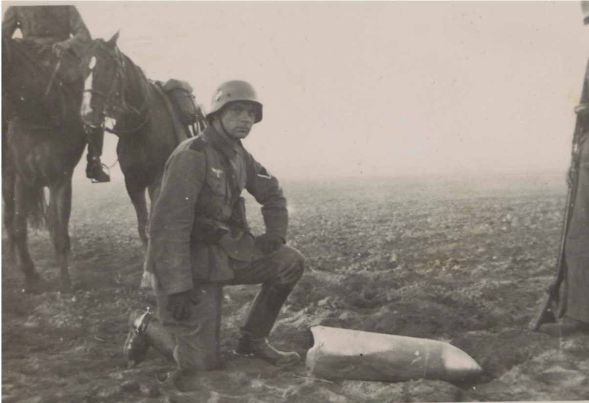
Fot. 5. Żołnierz nad bombą

W albumie znajdziemy niewiele fotografii dotyczących bezpośrednio walk polsko-niemieckich. Wyjątek stanowią dwa zdjęcia prawdopodobnie ukazujące pole bitwy pod Mławą, na których widzimy żołnierzy niemieckich pozujących przy bombie lotniczej.