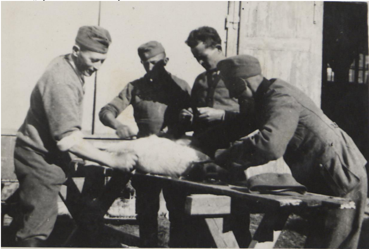
Fot. 7. „Żywienie we własnym zakresie”