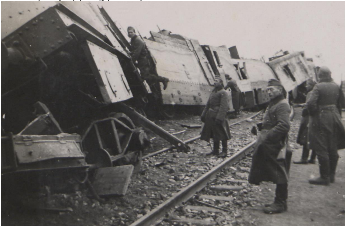
Fot. 8. Wykolejony pociąg pancerny