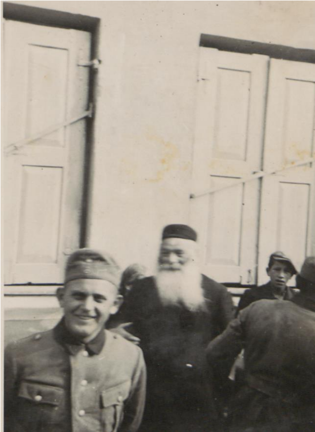
Fot. 5. Sanok. Prawdopodobnie autor albumu