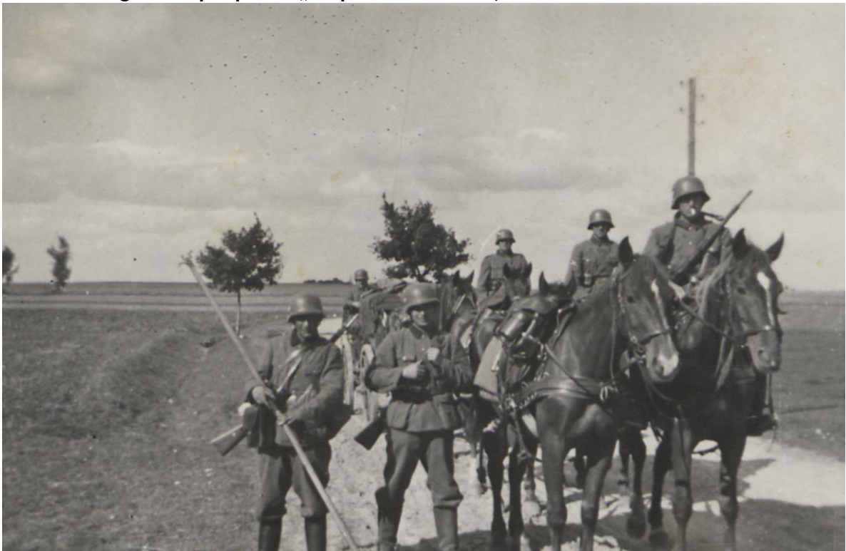
Fot. 4. Fotografia z podpisem „Po przekroczeniu”; obok data - 1.09.39.